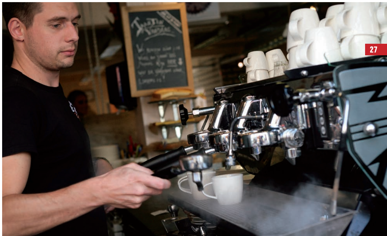
De Mirage, het pronkstuk van Coffee Corazon.

een uitgebreide boekenkast, de eigen bibliotheek van het bedrijf. “Die boekenkast straalt onze ont-haastingsvisie uit: neem de tijd om te genieten, van de koffie, je gezelschap, of een goed boek. Gasten mogen de boeken ook meenemen naar huis, geen probleem. De boeken heb ik voor een prikkie opge-kocht bij de bieb en uit inboedels.”