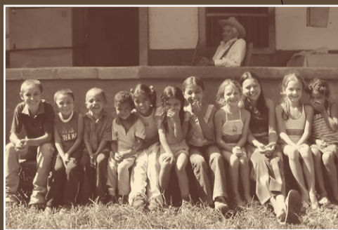
Kinderen op de El Llano koffieplantage in Colombia. Zouden ze al weten hoe heerlijk honingzoet hun koffie smaakt?

Veel plantage-eigenaren zien koffie nog altijd als bulkgoed en hebben zodoende hun eigen product nog nooit geproefd! Dankzij cupping-wedstrijden en educatie leren mensen op de plantages hun product goed kennen en waarderen. Bijkomend effect is dat goede cuppers vaak uit onverwachte hoek kunnen komen. Zo blijkt een schoonmaakster ineens één van de beste proevers van haar land te zijn! De nieuwe generatie zal wel opgroeien met het besef dat zij kostbare bonen produceren. Onze vraag naar zuivere koffie zal nog beter beantwoord kunnen worden. Wie weet zit er tussen deze vrolijke kinderen ook een meester-proever in de dop.